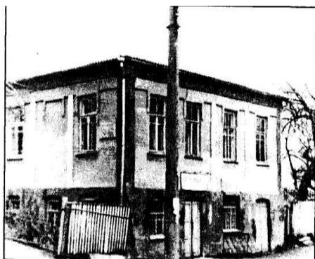
Фото 5. Будинок у Полонному, де раніше була міліція і катівня НКВС